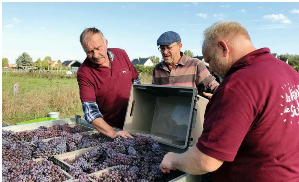
» La vendange 2018 a été particulièrement exceptionnelle en Wallonie. En cause, les conditions climatiques essentiellement, mais aussi des vignes qui commencent à prendre de l'âge et produisent donc davantage.