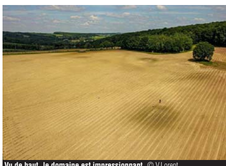
Vu de haut, le domaine est impressionnant.