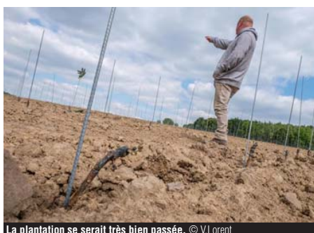
La plantation se serait très bien passée.